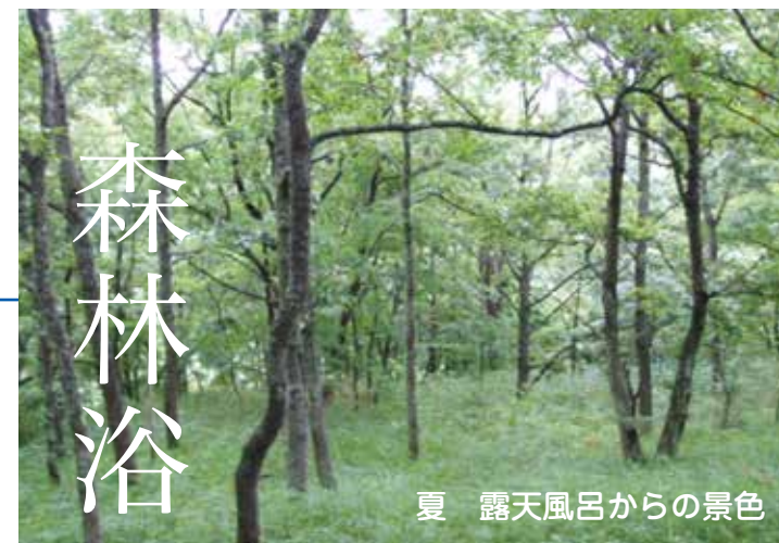
夏 露天風呂からの景色

別荘の愉しみ方は十人十色。でもそこにはいつも日常にはない、おだやかな時間が流れています。心を満たし、解き放つ喜びの時間が、別荘で過ごす一番の魅力なのです。