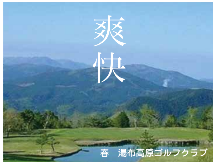
春 湯布高原ゴルフクラブ

文化や芸術の薫りに彩られ、町に漂う風雅な雰囲気が多い人々を惹きつける湯布院。この町の誕生は今から36年前、1972年のこと。湯布院の町と響き合いながら、九州屈指の別荘地として成熟を深めてきました。