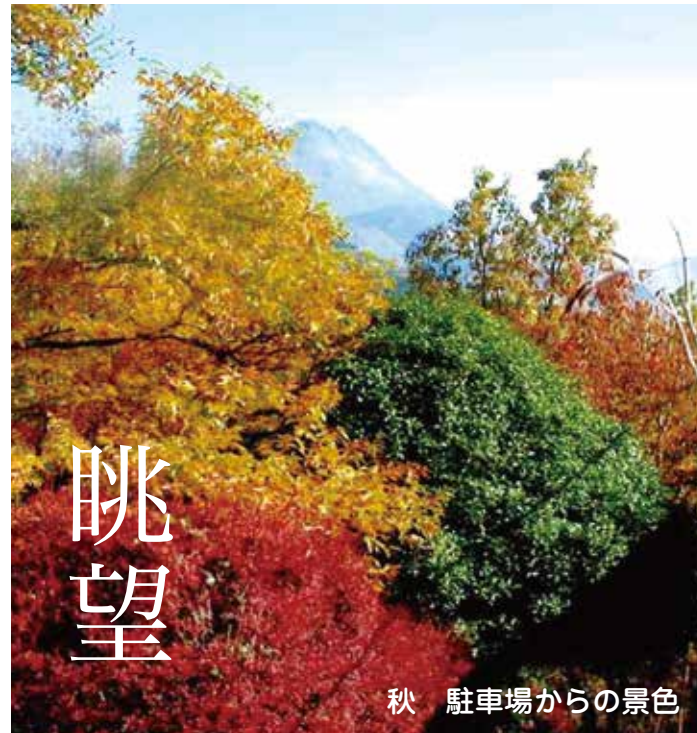
秋 駐車場からの景色